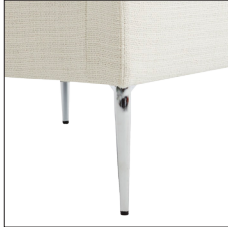
N° 2120 Aluminium