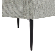
N° 2125 Zwart - Noir - Schwarz